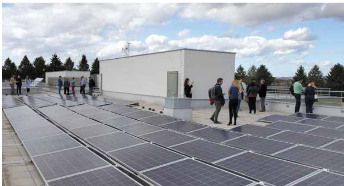
Slika 8 – Solarna elektrana 35 kW u Križevcima(Hrvatska) finansirana u potpunosti sredstvima građana

Prvi je primjer iz Hrvatske gdje je Zelena energetska zadruga 18 iz Zagreba (Hrvatska) realizirala projekat Križevački sunčani krovovi u sklopu kojeg je građanima ponudila finansiranje krovne solarne elektrane snage 35 kW. Ulaganje se moglo izvršiti pod slijedećim uslovima: iznos ulaganja minimalno 1000 a maksimalno 10.000 kuna (cca 1300 EUR) na 10 godina uz kamatnu stopu od 4,5% godišnje. Potrebni iznos investicije prikupljen je za 10 dana od ukupno 53 ulagača od kojih je 30% bilo iz Križevaca dok je prosječan ulog iznosio 580 EUR. Nakon ovog prvijenca Zelena energetska zadruga nastavlja sa realizacijom sličnih projekata u Križevcima.