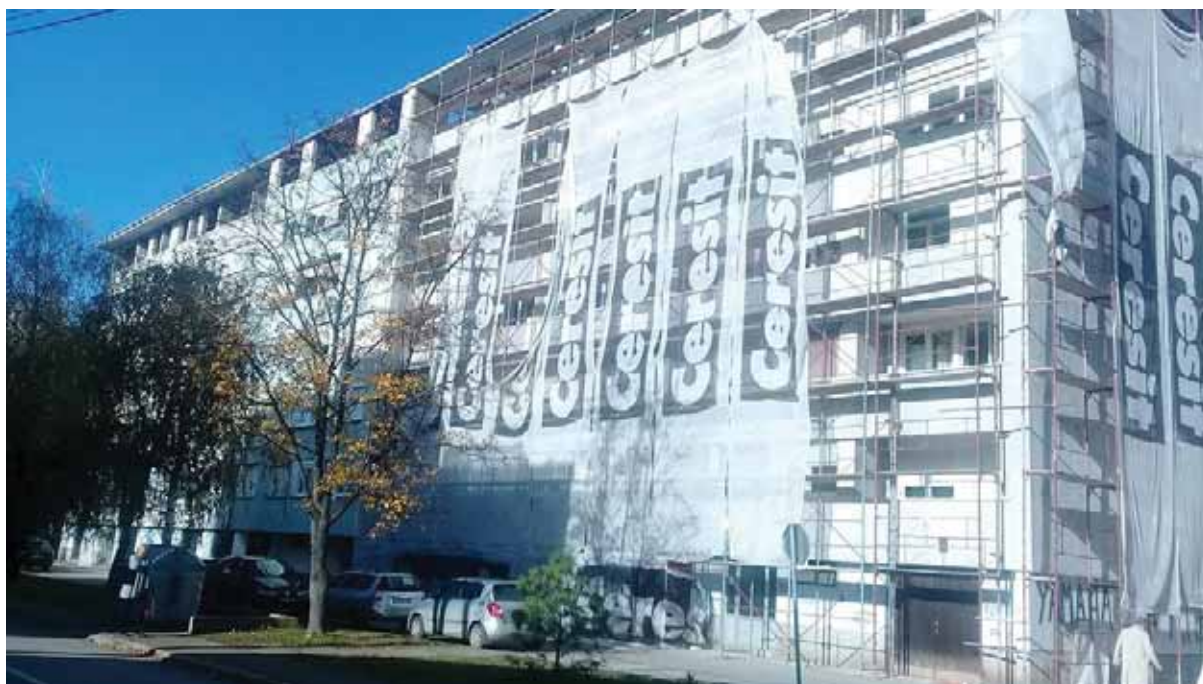
Slika 3. – Utopljavanje zgrade u Banjaluci po modelu dijeljenja koristi između stanara i investitora

ili da podigne kredit kod poslovne banke da bi se zgrada utoplila. Krajem 2018. godine ZEV je odlučio da pokuša problem da riješi tako što će naći investitora za nadogradnju objekta, a dobijanje saglasnosti stanara usloviti obavezom investitora da ugradi 3 lifta u zgradu i izvrši spoljašnje utopljavanje objekta sa izolacijom debljine 10 cm. Nakon što je sa gradskim vlastima i građevinskim stručnjacima provjerena mogućnost izgradnje nadogradnje na objektu ZEV je raspisao javni poziv investitorima. Na javni poziv javilo se ukupno 5 investitora od kojih je jedan pored ugradnje liftova, izoliranja zgrade i izrade fasade preuzeo i obavezu kompletnog uređenja unutrašnjih stepeništa. Nakon potpisivanja ugovora i dobijanja građevinske dozvole Investitor je uveden u posao i završetak radova se očekuje na proljeće 2020.godine.