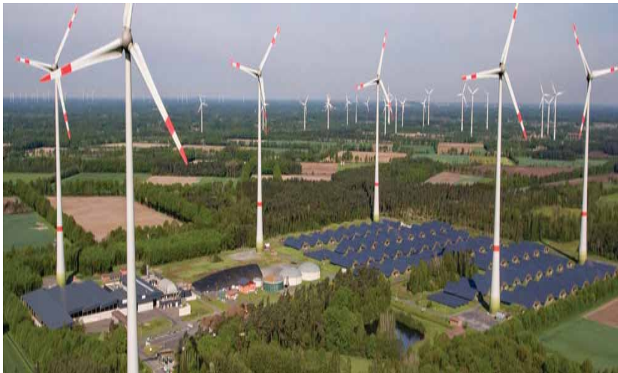
Slika 10 – Saerbeck (Njemačka) vjetro i solarni park sa proizvodnjom bio plina i pogonom za kompostiranje

U sklopu kompleksa izgrađen je i pogon za kompostiranje koji godišnje prerađuje 45.000 tona biološkog otpada i pri tome ima instaliranu snagu za proizvodnju 1 MW električne i 1 MW toplotne energije. Ovaj pogon je u vlasništvu regionalnih vlasti. Opština Saerbeck posjeduje i vlastitu distributivnu mrežu za distribuciju električne energije.