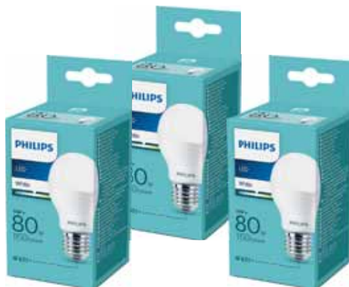
Slika 4 – Štedne LED sijalice

Nakon zamjene standardnih sijalica LED sijalicama od 80 W kupljenim u obližnjoj samoposluzi (slika 4) za ukupno 165,75 KM odnosno 4,25 KM po komadu prosječan mjesečni račun za stubišno osvjetljenje zgrade je pao na 42,24 KM čime je ostvarena mjesečna ušteda od 31,11 KM. Investicija za kupljenje LED sijalice se vratila u roku kraćem od 6 mjeseci a godišnja ušteda na troškovima stubišne rasvjete iznosi 373 KM.