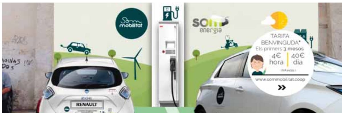
Slika 7 – Energetska zadruga SOM Mobilitat Barcelona (Španija)

Naime ova energetska zadruga je uvela sistem dijeljenja električnih automobila (car-sharing) pri kojem svako može putem mobilne aplikacije rezervirati i koristiti električno vozilo marke Renault ZOE dometa 400 km sa jednim punjenjem baterije uz novčanu naknadu koja je za članove zadruga niža od najma za ne-članove. Članarina u zadrugi iznosi 10 EUR godišnje, a finansiranje nabavke novih vozila se vrši tako što se u nekom gradskom kvartu sastane određeni broj stanovnika zainteresovanih za ovaj tip transporta i pokrene crowdfunding kampanju (skupno–zajedničko finansiranje) u kojoj zainteresovani građani iz tog kvarta uplaćuju unaprijed vrijeme korištenja električnog automobila. Kada se prikupi unaprijed određena količina novca nabavlja se električno vozilo i instalira punjač za baterije u tom kvartu, pa građani mogu početi koristiti to vozilo po sistemu najma i dijeljenja vremena. Energetska zadruga je neprofitna organizacija koja svoje troškove pokriva iz prihoda ostvarenog rentiranjem električnih automobila, a nabavka novih vozila se vrši na već opisani način.