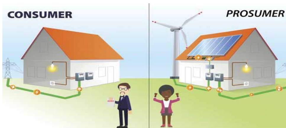
Slika 1. Osnovna razlika između kategorije potrošač ( consumer ) i proizvođač-potrošač ( prosumer ).

Na Slici 1. prikazana je razlika između konvencionalnih potrošača i prosumera.