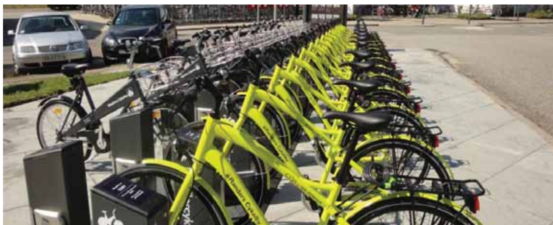
Slika 6 – Gradski (žuti) i prigradski (crni) bicikli za iznajmljivanje – Randers, Danska

Pored iznajmljivanja bicikala lokalne vlasti Randersa imaju još jedan interesantan program a to je mogućnost iznajmljivanja električnih bicikala za preduzeća . Cilj ovog programa koji se provodi pod nazivom „Posudi bicikl za posao“ je da se zaposleni koji putuju preko 5 kilometara automobilom na posao privole da koriste električne bicikle pa se program odvija u saradnji sa njihovim poslodavcima. Naime kompanija u kojoj radnik radi može iznajmiti električni bicikl za svog radnika na mjesec dana uz polaganje depozita od cca. 70 EUR pri čemu joj se po isteku mjesec dana naplati najam u iznosu od cca 14 EUR a ostatak vrati. Program je toliko uspješan da gradske vlasti moraju da ograniče najam električnih bicikala na 1 bicikl po kompaniji.