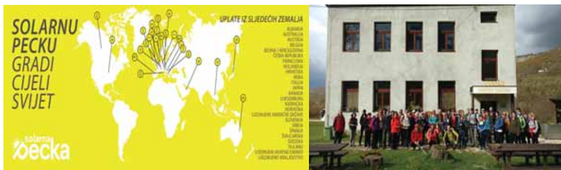
Slika 9 – Projekat Solarna Pecka, Mrkonjić Grad (BiH)

uplatili. Kampanja je trajala 30 dana (od 9.juna do 9.jula 2019.godine) i preko platforme za crowdfunding je prikupljeno ukupno 6.687 USD kroz 226 uplata iz 25 zemalja svijeta. Uz crowdfunding kampanju ujedno je vršena promocija projekta preko medija i kod sponzora tako da je dodatno prikupljeno kroz uplate na žiro račun i kroz različite donacije još dodatnih 7.000 USD pa je ukupna suma prikupljenih sredstava po podmirenju svih obaveza prema crowdfunding platformi i drugih troškova dostigla 12.611 USD što će omogućiti realizaciju svih aktivnosti koje su projektom planirane.