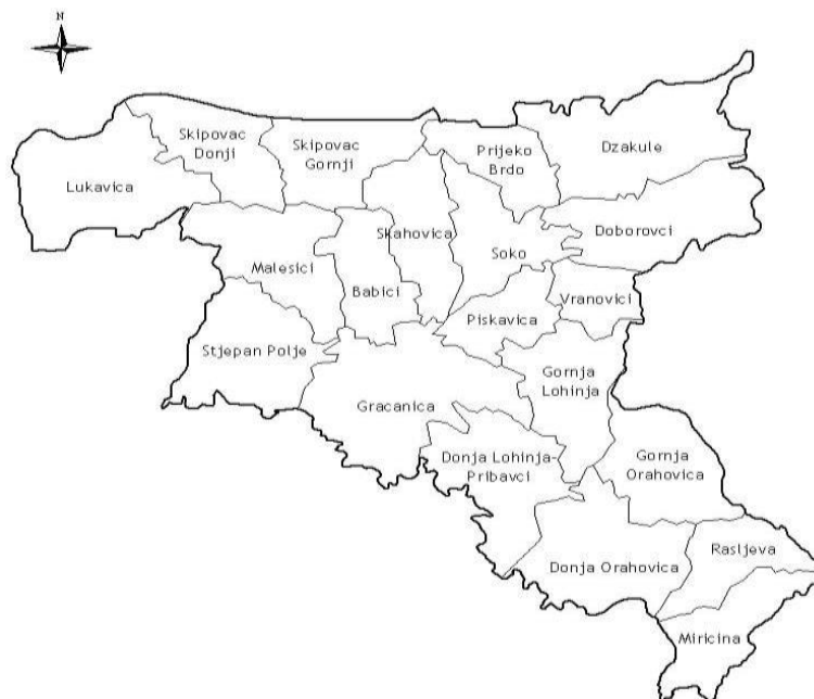
Slika (3): Mjesne zajednice Grada Gračanica i područja

Seoska naselja su razbijenog tipa i locirana su u nizijskom i brdskom dijelu grada.