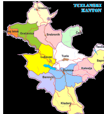
Slika (2): Geografski položaj Grada Gračanica u TK

Na prostoru Grada Gračanica su naselja organizovana i raspoređena: