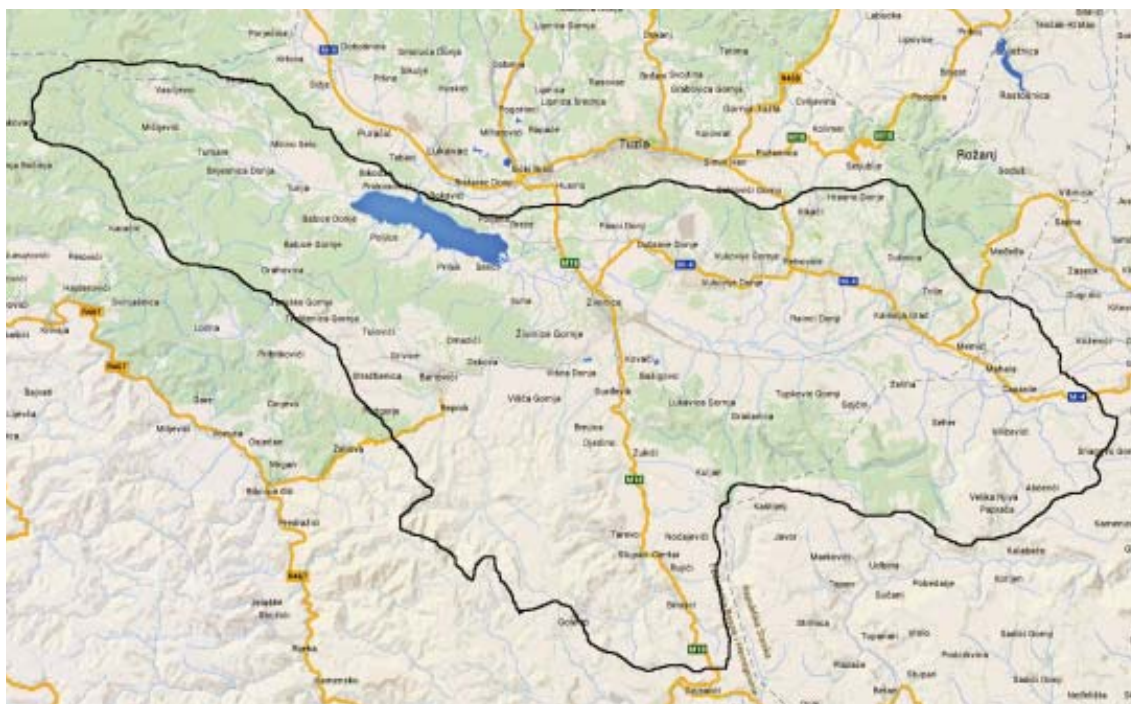
Mapa sliva akumulacije Modrac

U ukupnoj površini šuma slivnog područja državne šume participiraju sa oko 73%, a šume u privatnom vlasništvu sa oko 27%. Najvrednije i najveće površine šuma locirane su u gornjem toku rijeka: Spreča, Mala Spreča, Gostelja, Oskova i Turija.