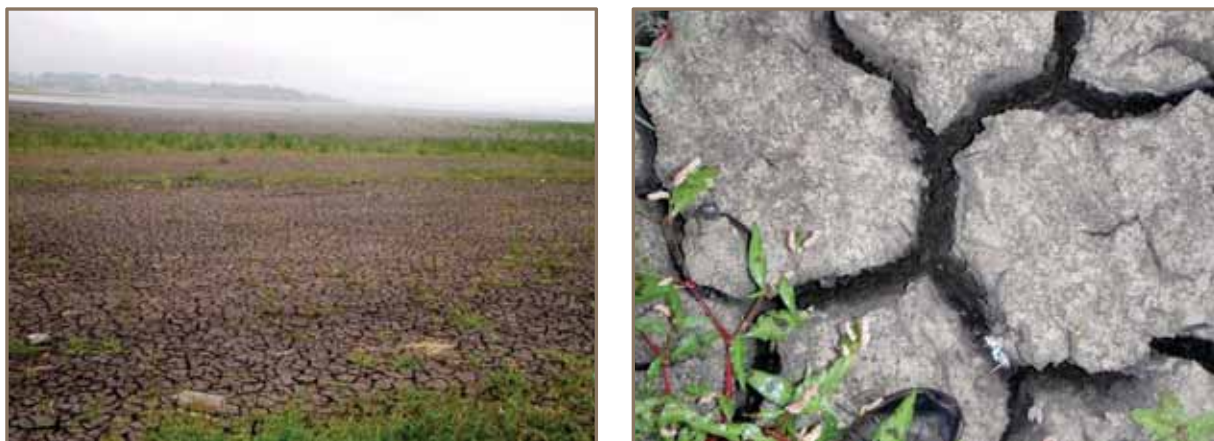
Slika 11. i 12. Izgled dna Akumulacije sa dijelom deponiranog nanosa u periodu suše (august 2012. godine)

Na slici 11. i 12. se najbolje vidi deponirani nanos u akumulaciju Modrac, snimljen u augustu 2012. godine, kada se povukla voda akumulacije Modrac usljed nedostatka padavina.