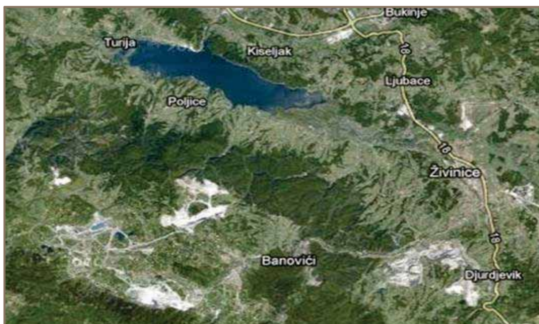
Slika 1. Prikaz Akumulacije i šireg dijela sliva akumulacije Modrac

Podaci dati u tabeli 1, ukazuju na značajne promjene morfometrijskih karakteristika Akumulacije do kojih je došlo od formiranja Akumulacije do danas. To se posebno ogleda kada je u pitanju zapremina nanosa koji je u proteklih 49 godina deponiran u Akumulaciji.