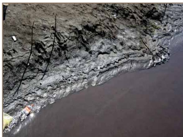
Slika 7. i 8. Izgled obala korita rijeke Spreče, na profilu prije ušća u Akumulaciju