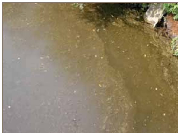
Slika 5. i 6. Izgled vode rijeke Spreče, na profilu prije ušća u Akumulaciju