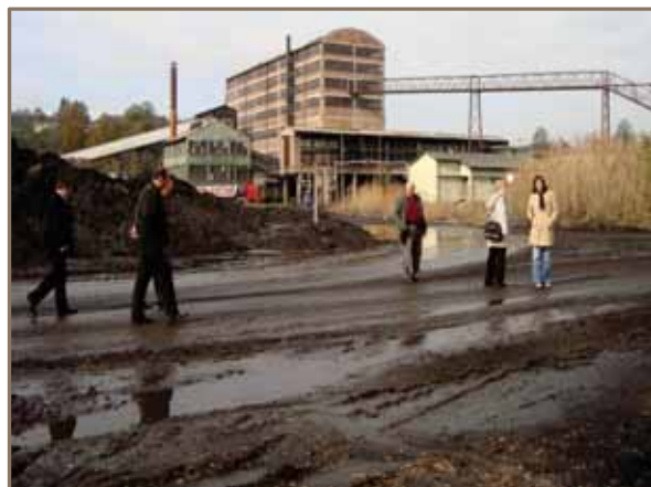
Slika 3. Rudnik Đurđevik