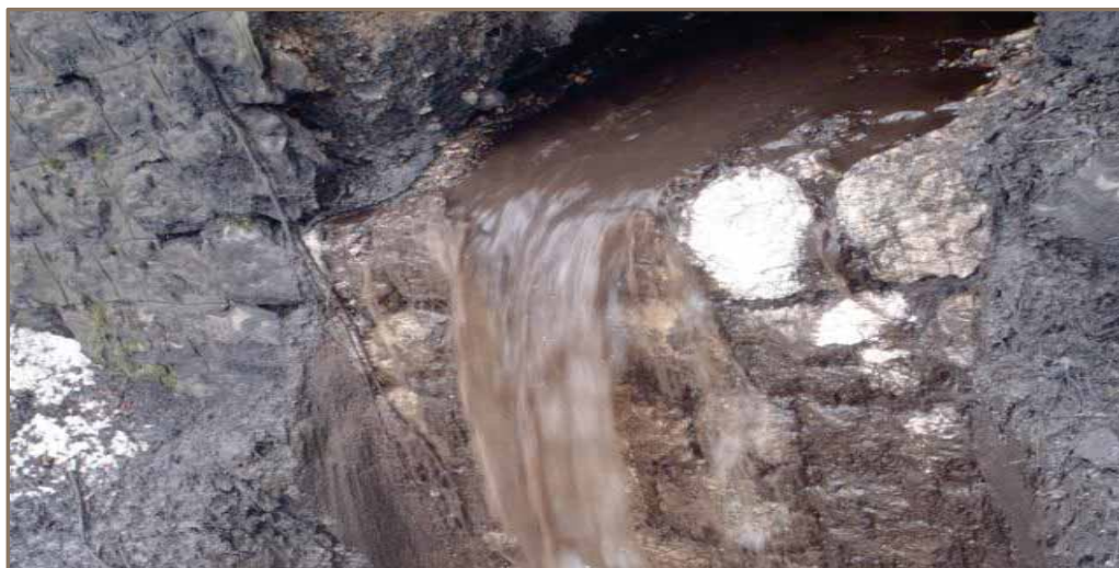
Slika 4. Ispust otpadnih voda iz Pogona "Separacije" (mart 2013. godine)

Imajući u vidu sadašnji postavljeni sistem za prečišćavanje otpadnih voda koje nastaju u procesu separisanja uglja, može se reći da Pogon "Separacije" ima "zatvoren" sistem otpadnih voda, što znači da se iz Pogona "Separacije" ne bi trebale ispuštati tehnološke muljevite vode. Međutim, i sada, na što ukazuju mnogobrojna ispitivanja obavljena na ispustu otpadnih voda iz Pogona "Separacije", u prirodni recipijent (vodotok Litve) se ispuštaju veće količine otpadnih voda sa visokim sadržajem suspendiranih materija (vidi: sliku 4.). To je, uglavnom, posljedica subjektivne prirode, odnosno neodgovornog vođenja procesa prečišćavanja otpadnih voda koje dovodi do pojave preljeva na prihvatnim bazenima, curenja na cjevovodima, prekida u radu pojedinih cjelina procesa prečišćavanja, neodržavanja zemljanih taložnika za prihvat otpadnih voda za slučaj havarija na postrojenju, nekontroliranog odlaganja izdvojenog taloga (mulja) iz postrojenja za prečišćavanje otpadnih voda i sl.