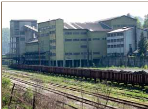
Slika 2. Rudnik Banovići

U procesu separisanja uglja koriste se značajne količine vode koje se u procesu opterete velikim sadržajem čvrstih materija (česticama uglja, laporca i laporovite gline). Zato je već kod puštanja Pogona u rad bio izgrađen i sistem za prečišćavanje nastalih muljevutih voda, koje su se ispuštale u recipijent. Sistem za prečišćavanje muljevutih tehnoloških otpadnih voda vremenom se dograđivao sa ciljem da se smanje količine i popravi kvalitet otpadnih voda, prije njihovog ispuštanja u recipijent. Međutim, od puštanja "Separacije" u rad pa do zadnjih obavljenih rekonstrukcija, 1981. i 1987. godine, iz Pogona "Separacije" ispuštane su značajne količine otpadnih voda sa velikim sadržajem suspendiranih materija (čestica uglja, laporca i laporovite gline).