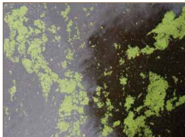
Slika 13. i 14. Prikaz razvijene vegetacije u Akumulaciji