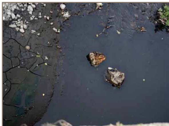
Slika 10. Izgled Akumulacije, vode i deponiranog nanosa, u području neposredno poslije ušća rijeke Spreče