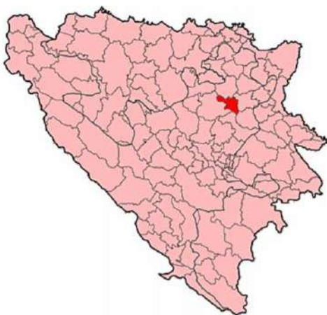
Slika 1: Položaj Općine Banovići

Veliki značaj predstavlja aerodrom „Tuzla International Airport“, udaljen oko 30 km od područja općine Banovići, koji omogućava povezivanje cijele regije sa susjednim i drugim državama.