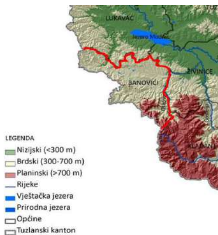
Slika 2. Reljef Općine Banovići u sklopu TK