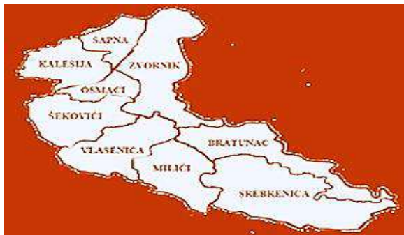
Slika 3. Opštine koje koriste usluge regionalne deponije

Skupštinu Javnog preduzeća čine gradonačelnik Grada Zvornika/ načelnici opština ili ovlaštena lica ispred svake od opština osnivača. Svaki član Skupštine Javnog preduzeća ima pravo glasa srazmjerno svom udjelu. Odluke se donose sa 51 % ukupnih udjela glasova.